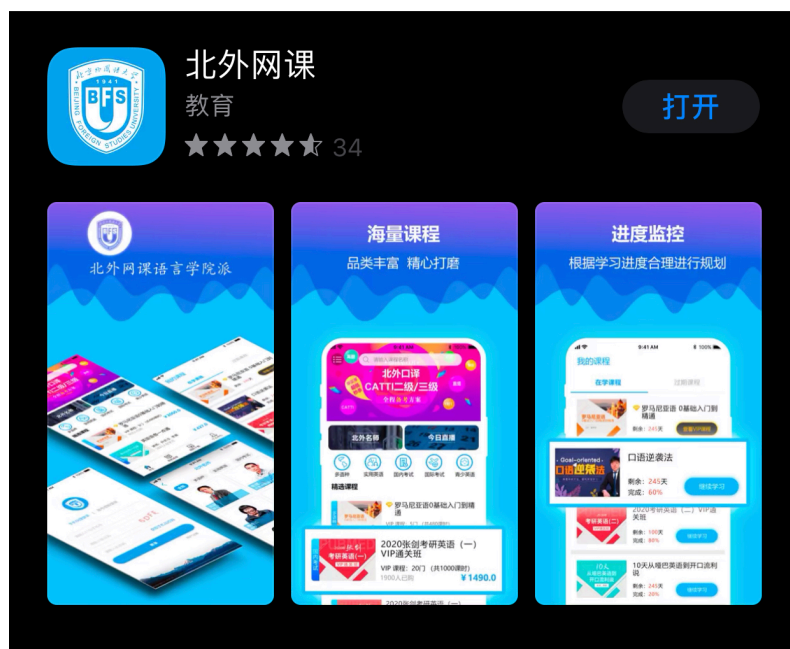
(“北外网课” app, 各大应用商城均有下载)