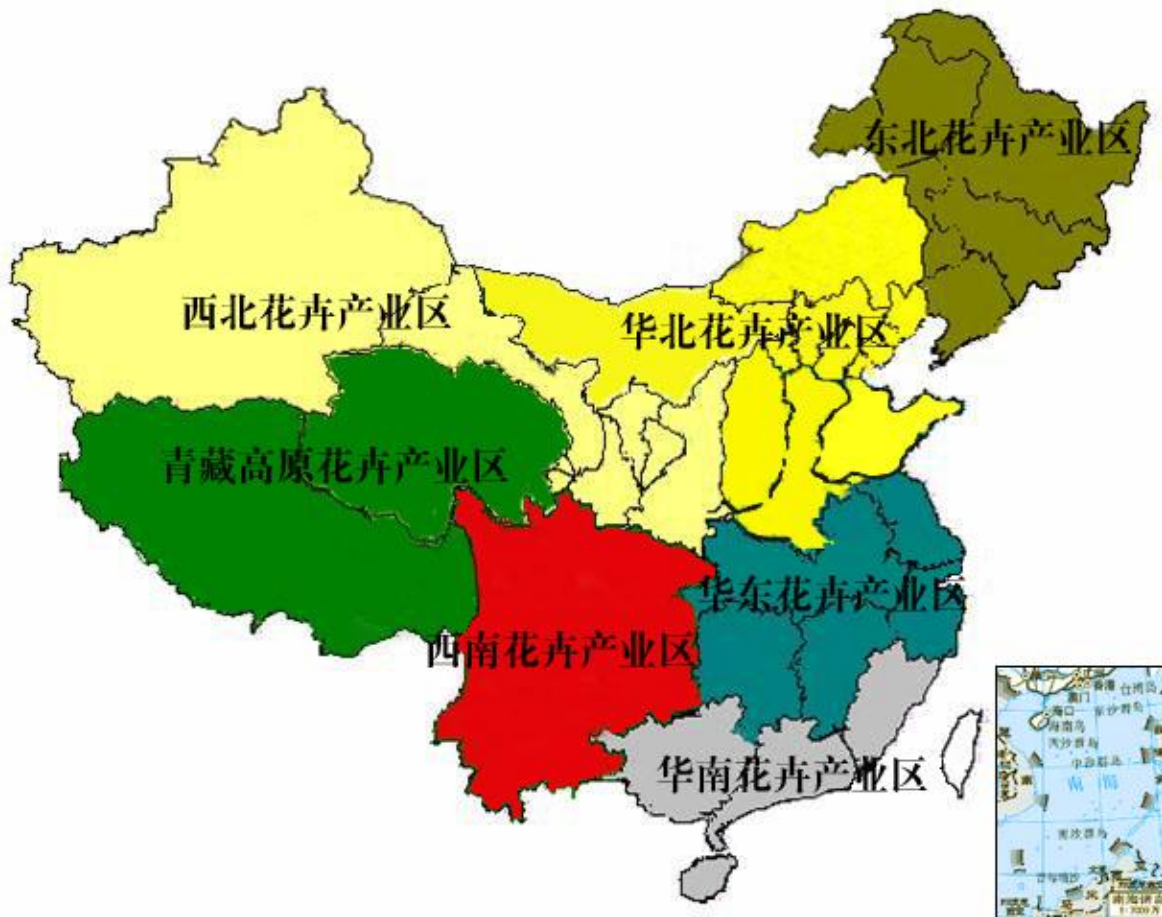
图 1：中国花卉产业布局示意图