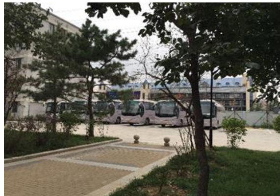
上图为西区停车场实景图