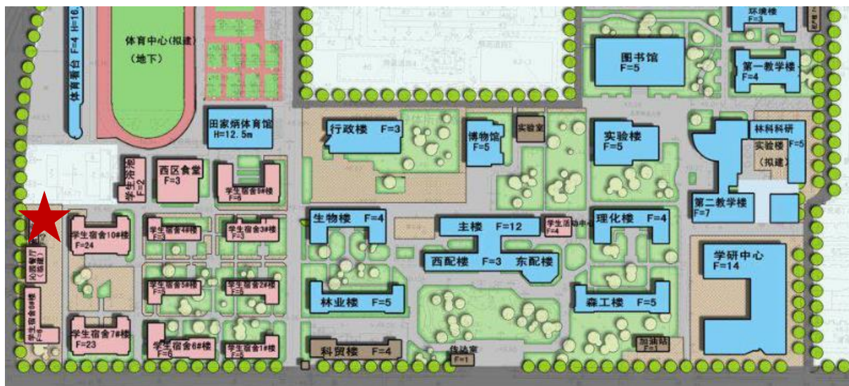
上图标注“★”为西区停车场位置