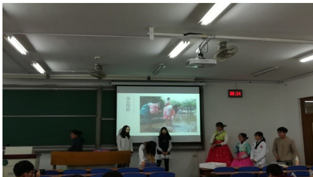
学生展示朝鲜族民族传统服装

今天听《旅游文化》课程，学生穿着瑶族、土家族、苗族等民族的衣服，表演这些民族的婚礼、山歌对唱、歌舞等民俗文化，民族民俗文化展现得有声有色，课堂氛围欢快热