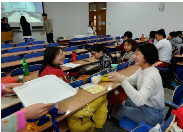
学生自制的土家族民族点心

烈。课后了解，所有的服装道具都是学生自己准备的。显而易见，学生的积极性被充分调动起来，我为老师创新的教学方式点赞！